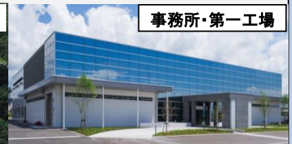
事務所・第一工場