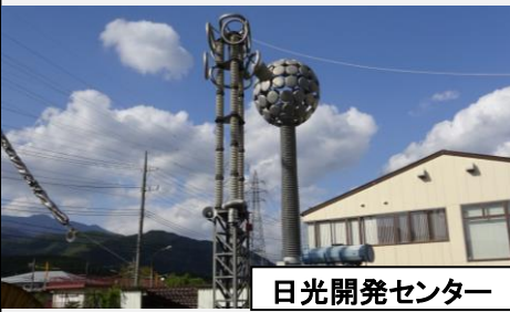
日光開発センター