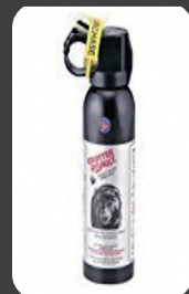
クマ撃退スプレー