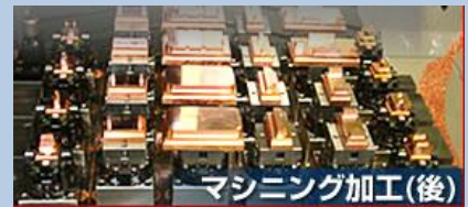
マシニング加工(後)