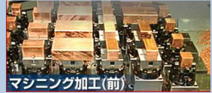
マシニング加工(前)