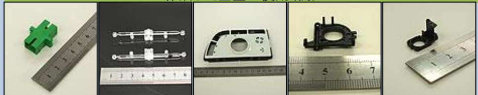
作成した金型の使用(例)

当社はハイエンドの3次元CAD/CAMと、高速機を駆使しての3次元形状プラ型と、極小プラ型を得意としております。