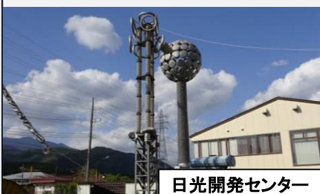
日光開発センター