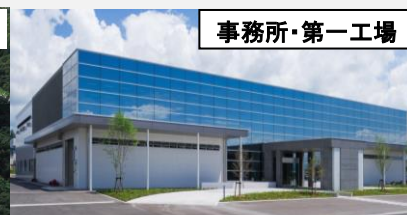
事務所・第一工場