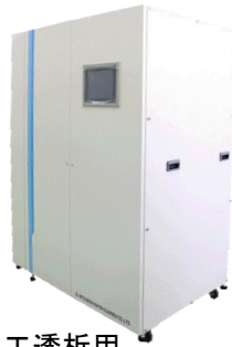
《人工透析用 高度精製水製造装置》

●大手水処理メーカーと製品化した理学療法用の高濃度人工炭酸泉装置シリーズを製造し、全国の医療機関、福祉看護施設などで使われています。