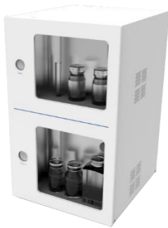
Sensing eye 332 全有機体炭素計

本シリーズは水処理装置、機器組込型の水質計ユーザーが、半導体業界や医薬用水の管理を主とする従来の市場に加え、近年、工作機械用、チラー用、細胞科学などの研究開発用に需要が他業種に拡大している現状を捉え、これら新しい顧客ニーズに幅広く対応すると共に、水質測定機能付コントロールユニットなど新機能、新技術を搭載しています。