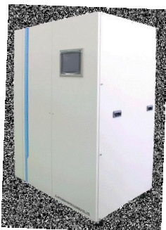
人工透析用 高度精製水製造装置