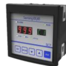
Sensing eye 781 水質測定付き コントロールユニット SC7