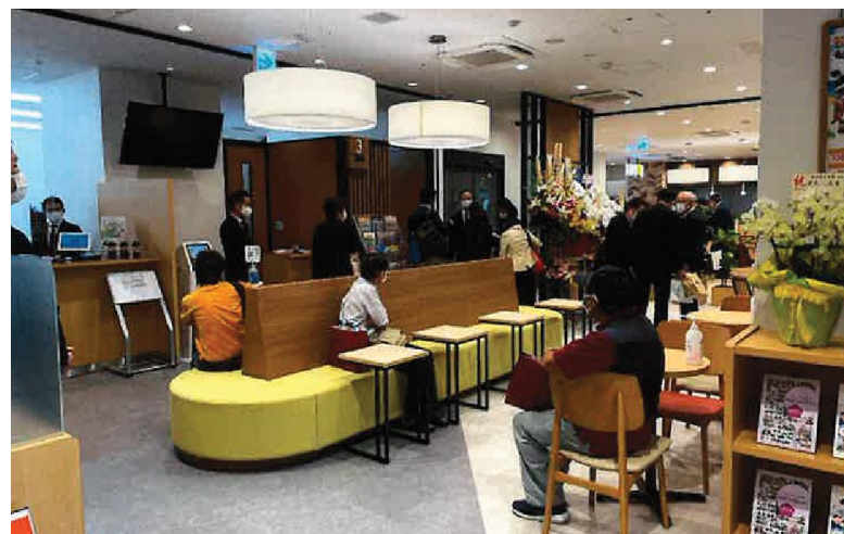
【参考】ドトール他店舗イメージ