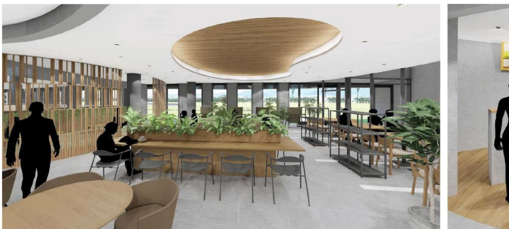
交流ラウンジ飲食スペースイメージ