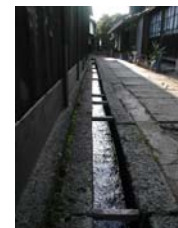
まちなかのせせらぎ