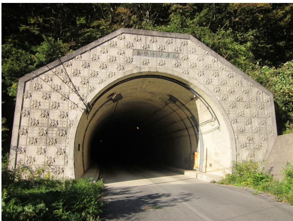
写真：高張トンネル