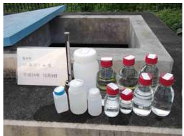
原水採水状況（水源地）