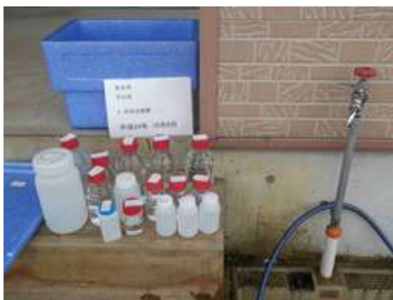
浄水採水状況（蛇口）