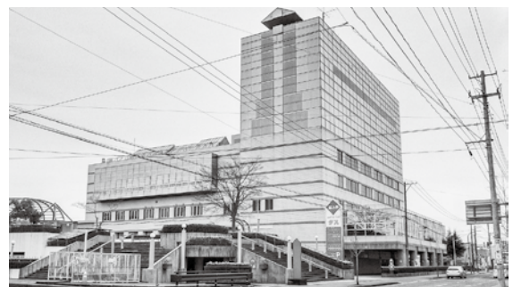
改修工事予定のタスビル

タスビル改修工事に向けた基本構想の取りまとめ、地方拠点整備交付金申請書の作成等、コンサル業者に発注する委託業務の一部を補助するため計上するものです。改修工事は地方拠点整備交付金を活用し、令和3年度に行う予定です。