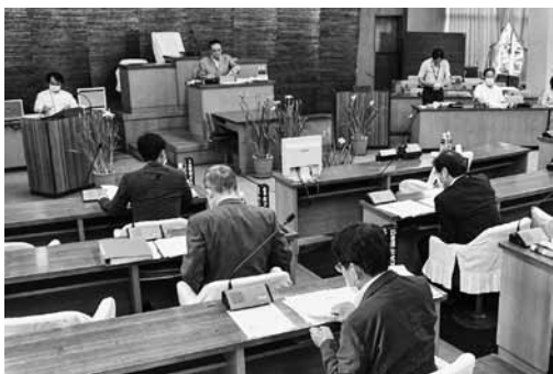
感染症対策実施中の議場