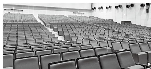
客席が広くなり一新されたホール