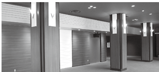
新たな雰囲気のホワイエ（玄関ホール）