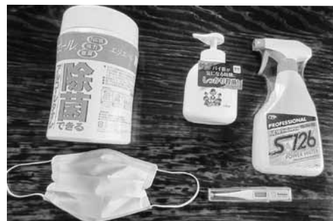
避難用備品に追加（消毒液、検温器、マスク等）