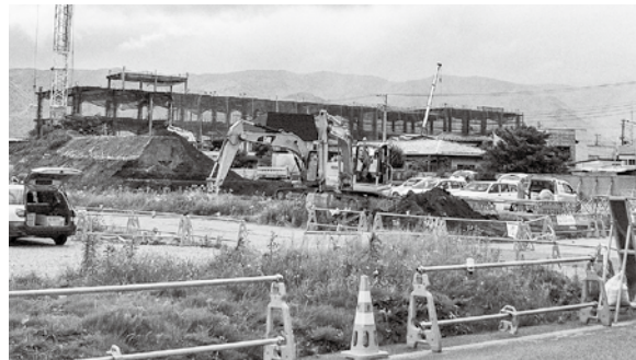
建築がすすむ新庁舎

新庁舎駐車場の請負契約で、工事の詳細は、盛土工事7040㎡、擁壁工事120㎡、側溝工事582㎡、舗装工事7308㎡、防護柵工事268㎡、照明工事16基です。