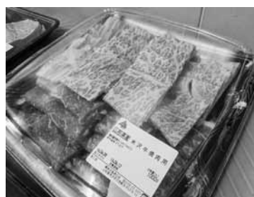
米沢牛消費拡大事業