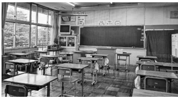
長期休業中の教室

Q: 新型コロナウイルス感染症の影響下で、本市の未来を担う子どもたちを育てている子育て世帯、さらにひとり子どもを抱え不安の中で生活するひとり親世帯への支援について、どのように考えているのかお聞きします。