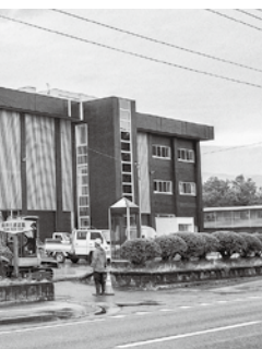
新たにスタートする市民文化会館

まで指定管理者制度を導入し運営する予定になっていましたが、公募の結果、指定管理者が決まらなかったため、やむを得ず令和2年度に限り市直営で運営することになりました。そのため、今年度当初予算に計上されていた指定管理料を減額し、その予算を直営の原資とし、増額分をプラスして運営するものです。