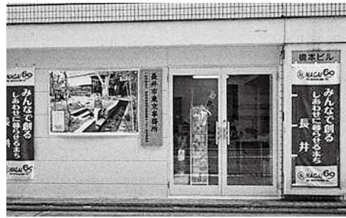
長井市東京事務所

きと思いますがいかがですか。 市長 東京事務所の機能を充実させる必要があり、情報収集のためにもふるさと長井会の事務局を東京事務所に置かせていただきたいと思います。首都圏の若い人たちの考えをもっと把握し、地方の情報も提供しながら、地方で暮らしたい若者に何らかの形で準備をしていきたいと思えます。