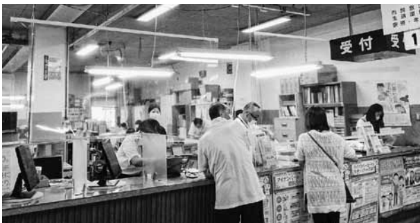
庁舎内の感染症予防対策（コロナシールド）

A. 経済支援対策は、国・県・市の情報を正しく伝えることが重要であり、各制度をしっかりと活用し、地域実情に合った政策を行うため、市長会を通して要望していきます。