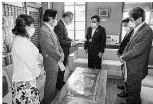
感染症対策に関する提言書を提出