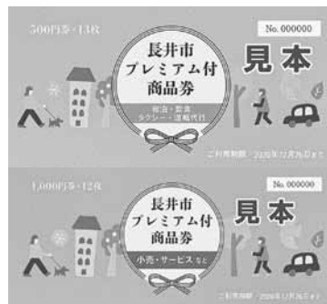
プレミアム付商品券