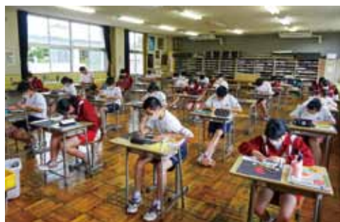
再開された市内中学校 ~新しい学校生活~