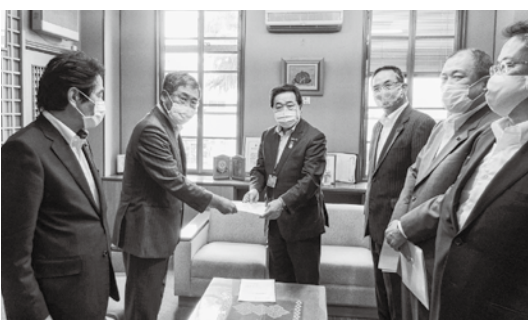
市当局へ提言書を提出

長井市議会として、「新たな市営バス運行システムに係る提言書」3項目、並びに「公共複合施設整備に係る提言書」6項目について、それぞれ十分に検討・配慮されるよう内容市長に提言しました。