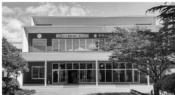
再開された小・中学校

Q: 小・中学校の休業が解除され、徐々に日常が戻りつつありますが、休業期間中の授業の遅れを取り戻す対応を伺います。特に中学三年生については、高校受験を控えており、希望の進路に進めるよう最大限の支援が必要で、自治体の対応の差で本市の子どもたちが不利益になるようなことは避けなくてはなりません。中学三年生の授業の遅れをどのように挽回するのか、詰め込む授業とならないよう、常に理解度に注視し進めていくべきと思いがたがいますか。