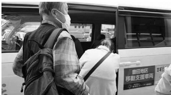
豊田コミセン買い物支援事業

A. 各コミセンでは住民意見を反映した地域づくり計画の査定により、地域の強みや課題を整理しています。また、コミセン運営協議会の事務評価の過程で組織内での課題共有を図っています。きめ細やかな福祉や防災等の事業実践が住民主体の共助の仕組みであり、引き続き推進していきます。