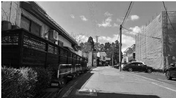
市道花作平山線（通称法讀寺通り）

市道花作平山線、通称法讀寺通りの消雪化を 答 弁 優先順位もあり、除雪車による丁寧な除雪で対応