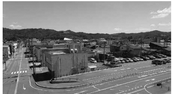
駅前通り（駅前市街地再開発予定地）