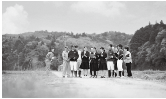
地域みらい留学（イメージ）