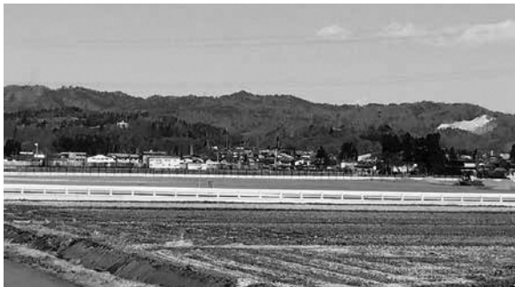
企業誘致が進む長井南産業団地

A: 姉妹都市であるドイツバート・ゼツキンゲン市を舞台とした当該オペラ公演については、プロのメインキャストの他、市民、県民が中心となった合唱団が出演し、どのような方も観客として楽しめるよう開催します。国の交付金も活用し、このような事業を今後も継続して実施いたします。