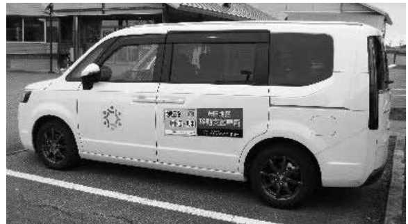
コミセン配置の移動支援車