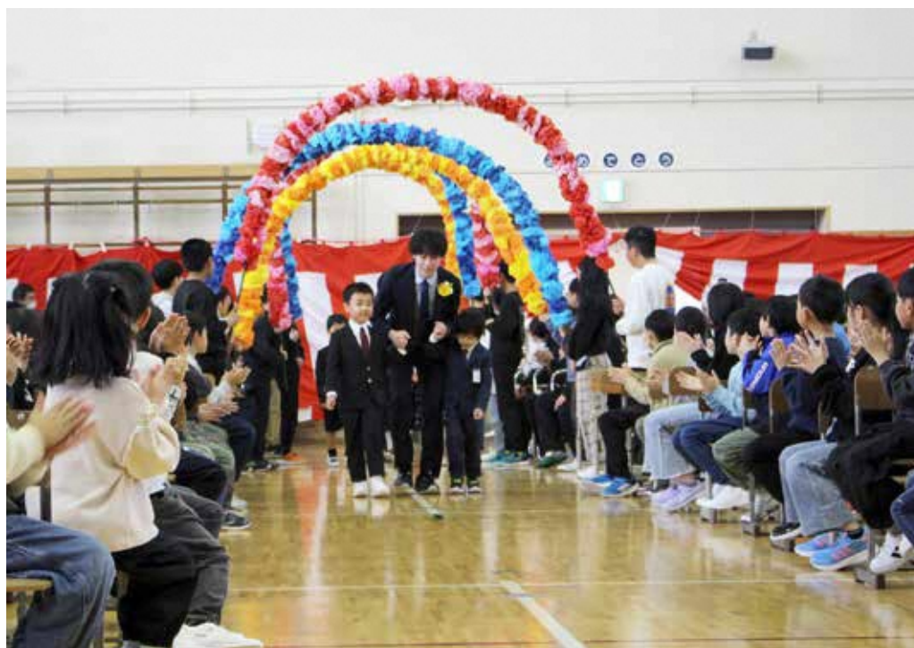
長井小学校入学式