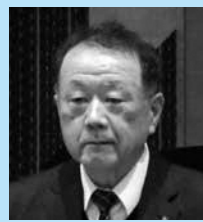
公明党 鈴木 英則