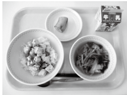
栄養バランスのとれた学校給食

A: 住宅リフォーム補助制度により、県の定める要件工事等に基づきアンカー設置等費用を支援しています。県に制度拡大の声を届けるとともに、多くの方に制度を活用いただくるように周知に努めます。