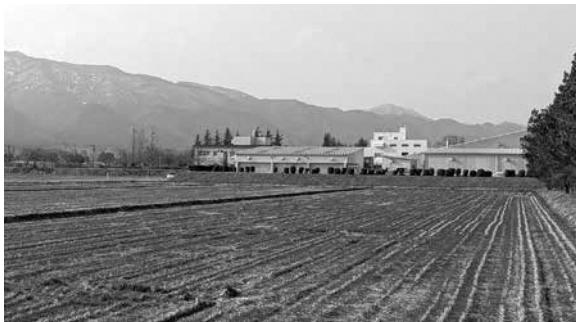
ハウス建設予定地（五十川地区）

A. 河川等の浚渫工事や支障木の撤去、田んぼダムによる貯留機能の確保や移動式排水ポンプの活用等の治水対策と並行して、デジタルツイン技術等を活用した各地区の防災力強化を推進してまいります。