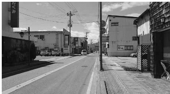
駅前通り (都市計画道路長井駅海田線)