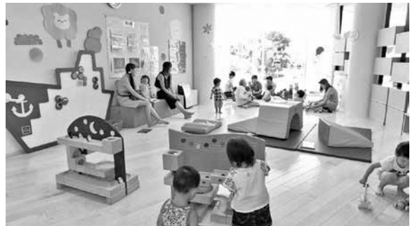
地域連携の子育て（イメージ）

Q: 製造業の企業が本市から無くなってしまうことはとても残念であり、ますます若者が離れてしまうのではと危惧します。若い人を選んでいただける新たな企業が必要ではないかと考えますが、これまで企業誘致に関してどのような取組をしてきたのですか。 A: パンフレットを作成し、県や金融機関、関係団体等へ情報提供を行ったほか、首都圏での様々なイベントに参加しPR活動を行ってきました。また、現在も県と連携して情