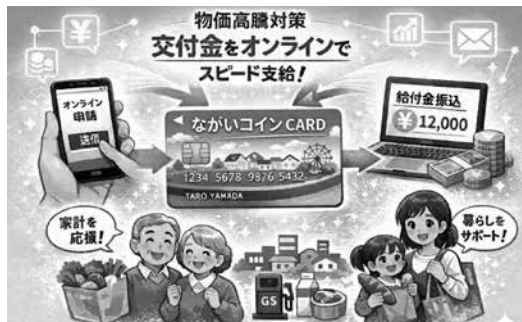
オンライン交付 (イメージ)