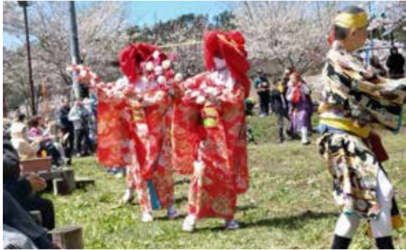
県指定無形民俗文化財 伊佐沢念仏踊