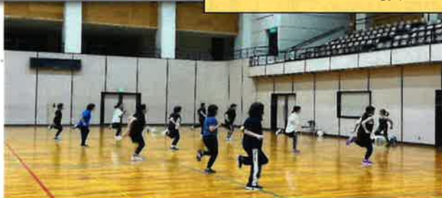
エアロビクス教室