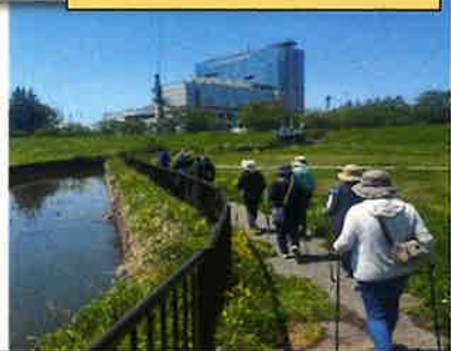
ウォーキング教室