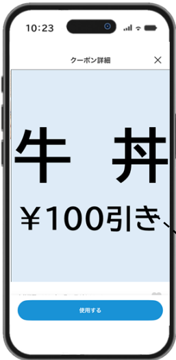
クーポン内容 (画像)