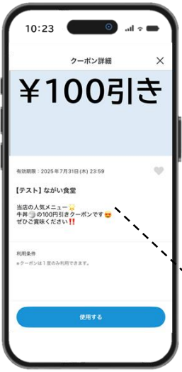
クーポン内容 補足説明