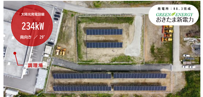
※ 太陽光発電所はPPA方式により、おきたま新電力（株）が設置しました。

また、毎日の給食米は「長井産のはえぬき」を使用しているため「食材と電力の地産地消」を達成しています。