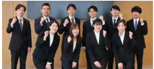
令和4年4月1日採用職員