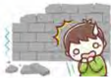
門塀の倒壊による 通行人への被害