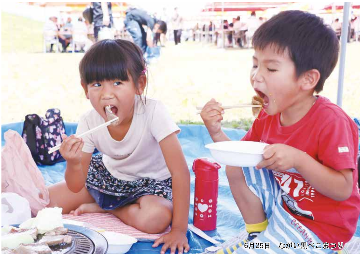
6月25日 ながい黒べこまつり