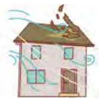
強風で屋根や 壁が飛ばされる