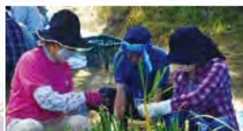
▲枝分け作業の様子