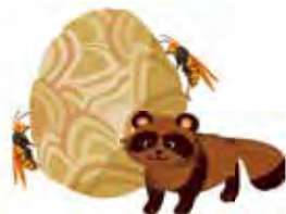
動物やスズメバチの住処になる