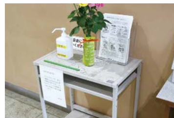
●入口に消毒液を設置しています