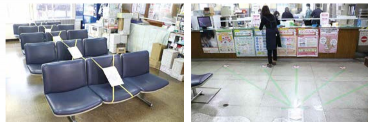
●お互いの距離を保てるようにしました

外出する機会が減り、自宅で過ごすことが多くなっています。 自宅で家族がそろう機会も増え、嬉しい反面、悩みやストレスを抱えてしまうこともあります。 そこで少しでも自宅時間を快適に過ごせるようなヒントや気を付けたいことをご紹介します。