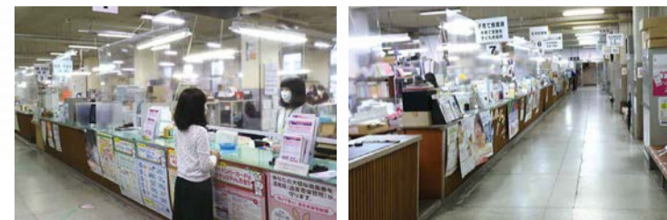
●飛沫感染防止のためにビニールカーテンを設置