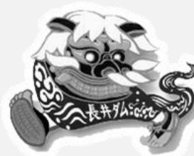
ながい黒獅子大綱引き