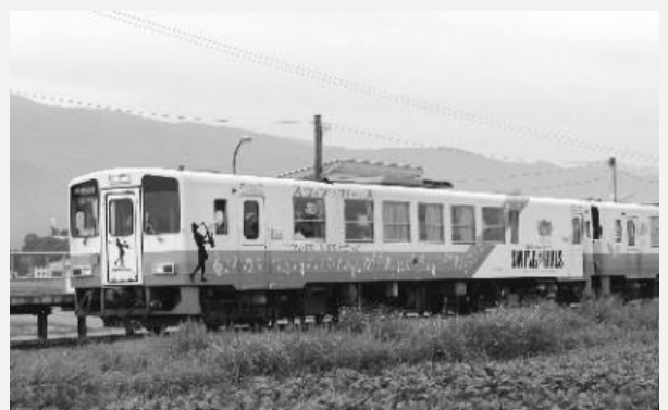
【スウィングガールズ号】