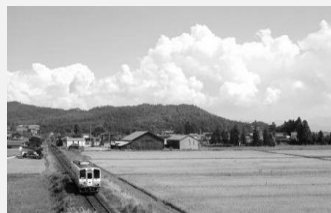
【青い空、白い雲 のどかな田園風景】