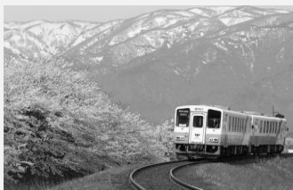
【雪解けの山と満開の桜】