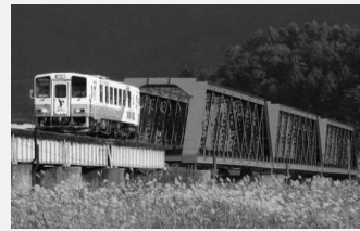
【現役日本最古の鉄橋 最上川橋梁】 (旧東海道本線の木曾川橋梁を移設)