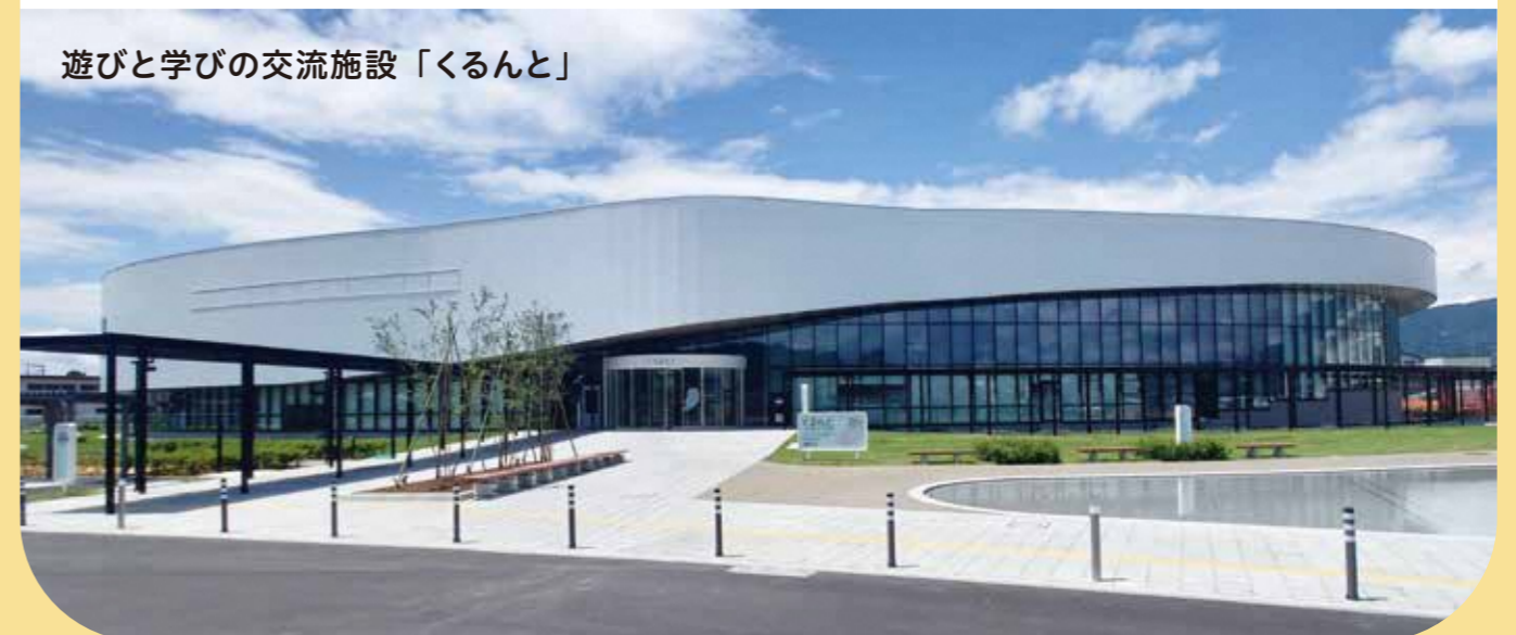
遊びと学びの交流施設「くるんと」