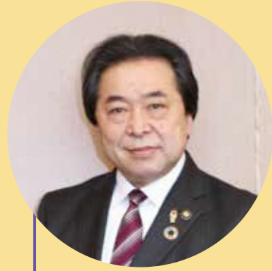
長井市長 内谷 重治

近年の不安定な国際情勢や、それに起因する物価高に加え、超高齢化社会の到来など、私たちの生活や長井市を取り巻く社会環境は大きく変化しています。そうした中で長井市では、市民一人ひとりが主役となる持続可能なまちづくりに向け、令和7年度から「地方創生 2.0 コミュニティ拠点機能構築事業」に着手し、人口減少が進む社会にあっても、住み慣れた場所で安心して暮らせる地域の形成に取り組んでいます。