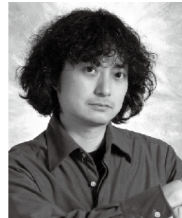
演出 粟國 淳