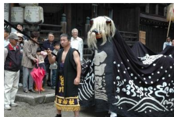
總宮神社の獅子舞