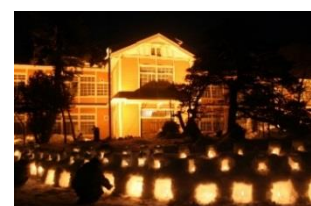
旧長井小学校第一校舎