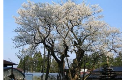
草岡の大明神ザクラ