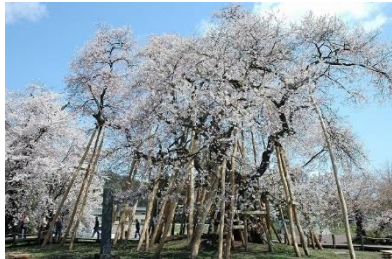
伊佐沢の久保ザクラ