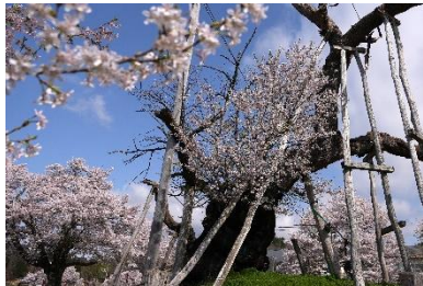
伊佐沢の久保ザクラ