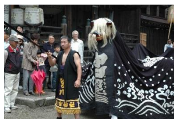
總宮神社の獅子舞